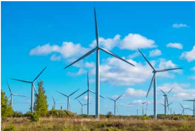
▲ Door de erkenning ontvangt Natuurpunt nu jaarlijks subsidies voor het domein.

In het voorjaar vernamen we dat er op het industrieterrein van Hulshout vijf windturbines zouden komen met een hoogte van iets meer dan 200 meter. De timing, locatie en omvang van het project waren op zijn zachtst gezegd ongelukkig gekozen. Niet alleen zouden de megaturbines veel te dicht bij onze woonkernen van Hulshout en Heultje komen, de coronacrisis maakte het bovendien nog eens onmogelijk om informatie te verkrijgen over het technisch dossier van meer dan 600 pagina's.