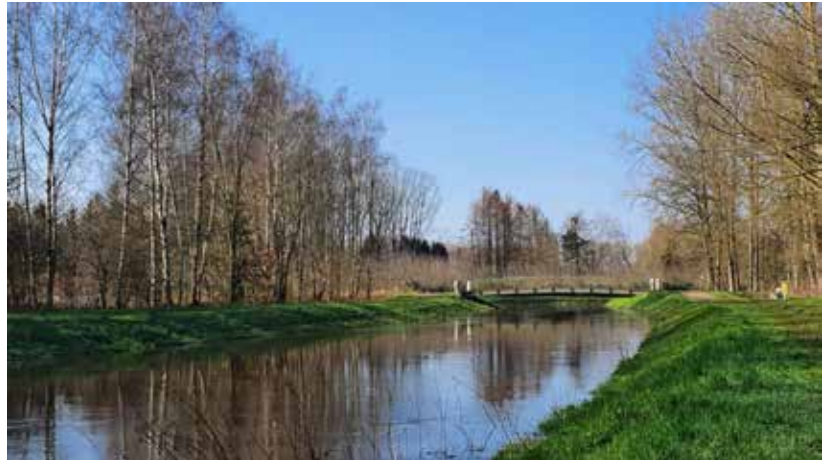
▲ Door de erkenning ontvangt Natuurpunt nu jaarlijks subsidies voor het domein.